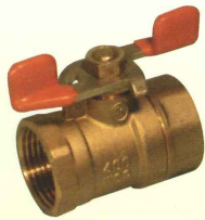
8A及び10Aはフルボア仕様