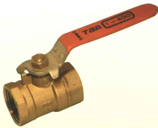
8A及び10Aはフルボア仕様