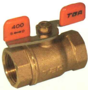
8A及び10Aはフルポア仕様