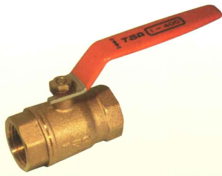
8A及び10Aはフルポア仕様